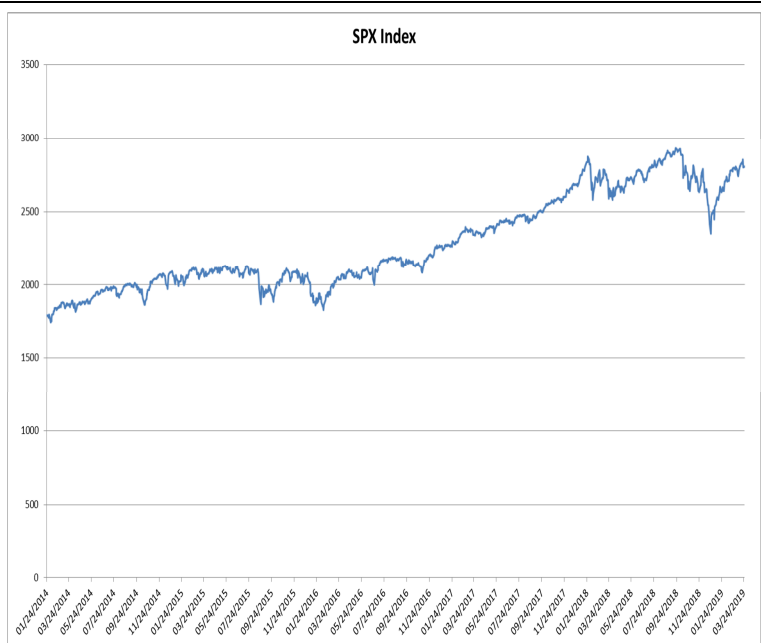
Ovanstående diagram visar kursutvecklingen för S&P 500® Index på S&P Dow Jones Indices LLC..