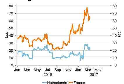
Ränteskillnad mot Tyskland, 10-årig statsobligation

Anm: Peilingwijzer är en sammanfattning av opinionsmätningarna EenVandaag/Intomart GfK, Ipsos, I&O research, Kantar Public, LISS Panel and Peil.nl