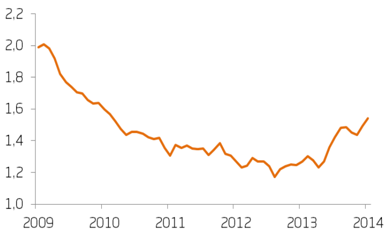
Australienska dollar EUR/AUD