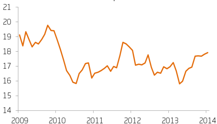
Mexikanska peso EUR/MXN

Kursutvecklingen uttryckt som antal mexikanska pesos per en euro, det vill säga hur många pesos som krävs för att köpa en euro. En fallande kurva visar således att valutan stärkts mot euron (det krävs färre pesos för att köpa en euro) och en stigande kurva att valutan försvagats mot euron.