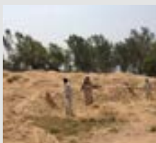
Stora Ensos verksamhet i Pakistan

Några av Stora Ensos leverantörer i Pakistan har använt barnarbete för att samla in returpapper. Vi reste därför till Pakistan för att undersöka hur Stora