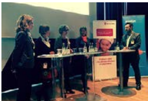
Seminarium med bolag kring barns rättigheter

Under 2014 analyserade vi koldioxidutsläppen för våra hållbarhetsfonder med syfte att minska fondernas klimatpåverkan och under 2015 kommer vi beräkna och externt redovisa koldioxidavtrycket hos ett 50-tal aktie- och blandfonder.