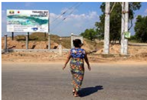
Tvångsflyttningar vid Thilawa Special Economic Zone utanför Yangon, Burma

På årsstämman i TeliaSonera röstade Swedbank Robur mot att bevilja ansvarsfrihet för en av de tidigare verkställande direktörerna, vilket också blev bolagsstämmans beslut. Revisorerna kunde varken till- eller avstyrka ansvarsfrihet mot bakgrund av de pågående granskningarna och utredningarna om transaktioner i Euroasien. De hade inte kunnat bedöma om eventuell skada för bolaget kan uppkomma på grund av uppsåtlig eller oaktsam förvaltningsåtgärd.