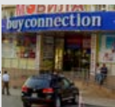
Telekom i Uzbekistan

TeliaSonera har anklagats för korruption och bristande hänsyn för mänskliga rättigheter i verksamheterna i Eurasien. Vår syn är att bolaget ska ha verktyg för att kunna identifiera sina korruptionsrisker och mekanismer för att kunna kontrollera dessa risker. Bolaget ska arbeta aktivt för yttrandefrihet och integritet på de marknader där de är närvarande. Vi har under året löpande