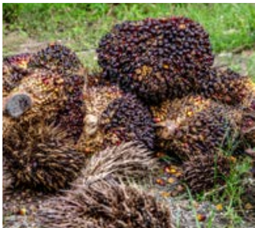
Palmoljefrukt från Malaysia

Vi fortsatte att engagera oss i samarbetsinitiativ inom PRI om korruption, palmolja, oljesand och fracking (en metod för att utvinna naturgas i skifferlager genom att injicera vatten och kemikalier under tryck i ett borrhål i marken). PRI:s arbetsgrupp kring palmolja har under året främst inriktat sig mot odlare av palmolja framför allt i Malaysia och Indonesien. Genom initiativen verkade vi bland annat för att bolagen ska sätta mål inom ett antal kritiska områden och vara öppnare i sin externa kommunikation.