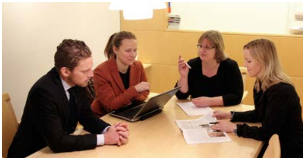
Hållbarhetsanalytikerna har analysmöte