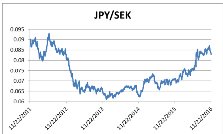
Ovanstående diagram visar kursutvecklingen för JPY/SEK på The World Markets Company PLC.