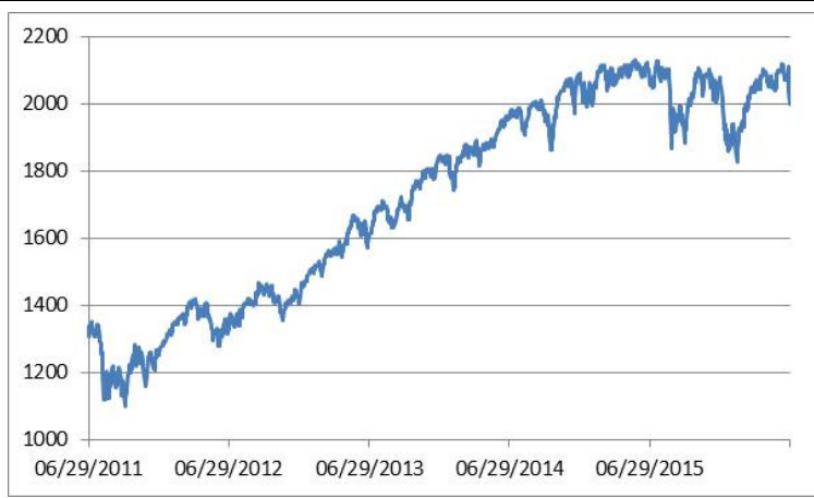
Ovanstående diagram visar kursutvecklingen för OMX Stockholm 30 Index på The NASDAQ OMX Group, Inc..