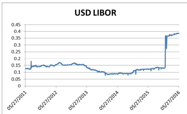
Ovanstående diagram visar utvecklingen för USD LIBOR overnight.

Det bör observeras att historiskt material och historisk utveckling inte utgör någon garanti eller prognos för framtida utfall. Källa: